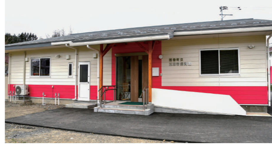
令和5年度に完成した五日市保育園

令和5年度の決算が町議会9月定例会議で認定されました。決算の概要から見た町の財政状況についてお知らせします。