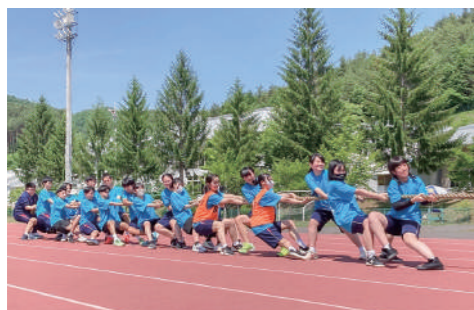
クラス一丸となって戦った綱引き

りました。各種目の順位でクラスに得点が入り、総合得点でクラスの順位が決まるため、みんなクラスのために頑張っていました。三大行事の一つが終わり、次は秋に葛高祭があります。これもまた盛り上がるので、ぜひいらしてください!