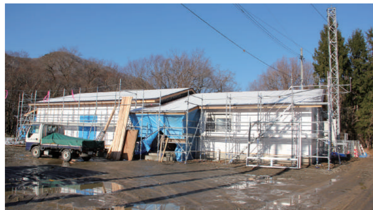
完成が待たれる冬部コミュニティセンター

●町下水道事業の地方公営企業法の全部適用に伴う関係条例の制定 公営企業会計へ移行することに伴い関係する条例を整備。