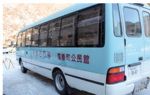
地域で長年親しまれた移動図書館車