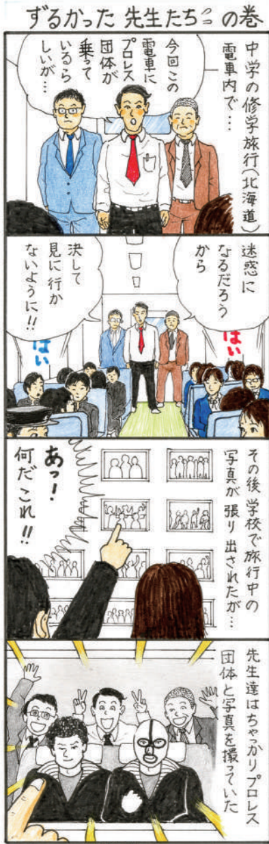
※当時は白黒写真だった。(実話)