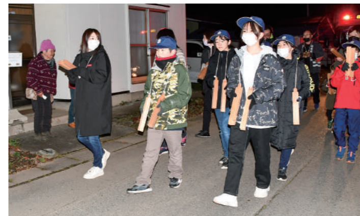
拍子木を鳴らしながら各家庭に火の用心を呼び掛ける子どもたち

11月11日、小田少年消防クラブの子どもたち6人が、消防団員や保護者と共に小田地区で夜警を行いました。