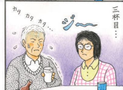
飲みすぎに注意しましょう! (実話) (オマエが言うなッ)