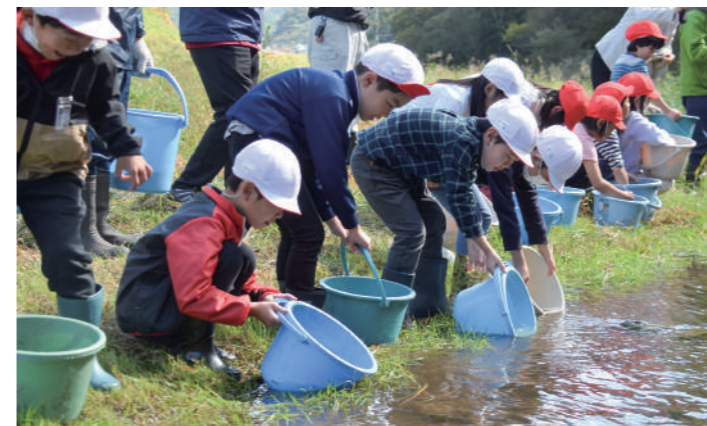
馬淵川にヤマメの稚魚を放流する児童たち

上馬淵川漁業協同組合は10月12日、葛巻小学校近くの馬淵川河川敷でヤマメの稚魚約3,000匹を放流しました。