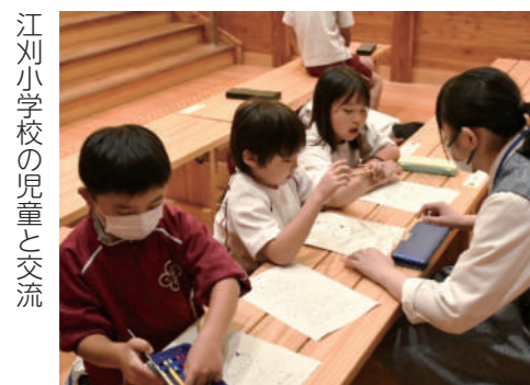
江刈小学校の児童と交流

夏休みが明け、前期末考査も乗り切り、どこからか安堵の空気が流れる校内。そんな中、私たちは9月13日に総合的な探究の時間で江刈小学校におじゃましてきました。私たちが「しゅわにけーしょん」という小学生と手話で交流する活動をしています。インターシップでも訪問していたので、江刈小学校の皆さんとは面識があり、久しぶりに会えるのを準備段階からとても楽しみにしていました。私が思っていた以上に楽しんでくれていた様子で、当日のギリギリまで準備と確認をした甲斐があったと思います。今後の活動に生かせる課題とやる気を小学生の皆さんにだけ、さらに良いプロジェクトになりそうだと感