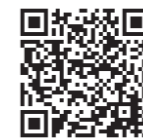
山村留學生募集情報(町ホームページ)

町は、令和6年度に「くずまき山村留學生」として岩手県立葛巻高等学校に入学する生徒を全国から募集します。詳しくはお問い合わせください。