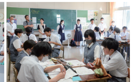
公民の授業を見学する様子