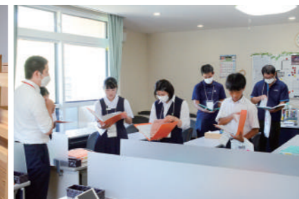
学習塾の教材を手に取る参加者