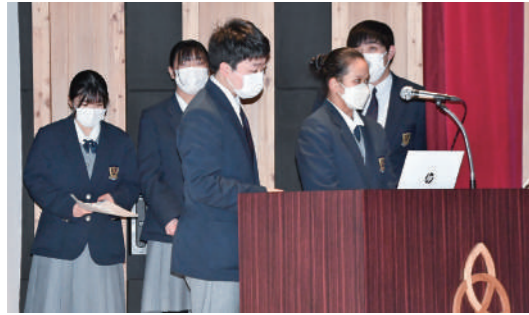
プロジェクトを発表する2年5班の皆さん