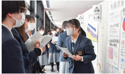
ポスターセッションで探究内容を説明