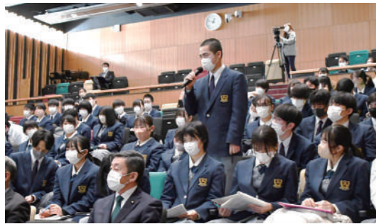
発表内容について質問する生徒

2月22日、1、2年生98人が「総合的な探究の時間」の成果報告会をくずまのまき×まきホールで行いました。令和4年度の探究は学年ごとに11班に分かれて活動。生徒たちは探究の内容や取り組みをまとめたポスターを発表していました。2年生は町の自然や歴史、食に関する探究など地域に密着したテーマで、昨年から探究を掘り下げていました。また、1年生は制服改革やごみのポイ捨て問題など身近なテーマを探究するなど多様な内容となりました。 その後、投票で「応援したいプロジェクト」に決まった各学年の上位3班が、ステージ発表を行いました。2年生トッ