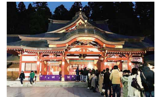
天羽隊員が撮影した初詣客が並ぶ盛岡八幡宮

そして今年度もあとわずか。1、2年生にはこれからの自分の人生について、大いに悩んで考えてほしいと思います。