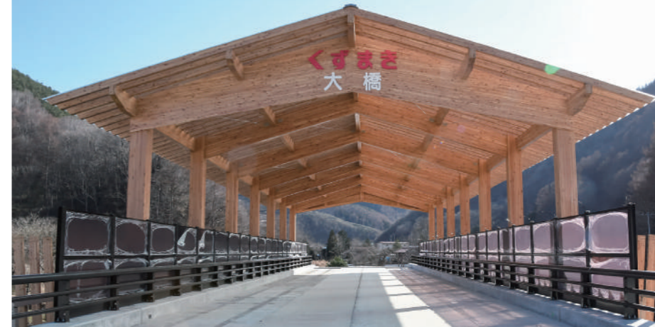
令和4年3月に完成した大橋の木製上屋

令和3年度の決算が町議会9月定例会議で認定されました。決算の概要からみた町の財政状況についてお知らせします。