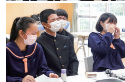
江川中生④の演技を交えた方言クイズに思わず笑出す北中城中生