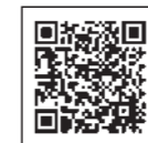
会計年度任用職員募集ページ

町では令和4年度の会計年度任用職員および業務委託職員を募集しています。 募集職種など詳しい内容は全戸配布の募集のご案内またはホームページをご確認ください。