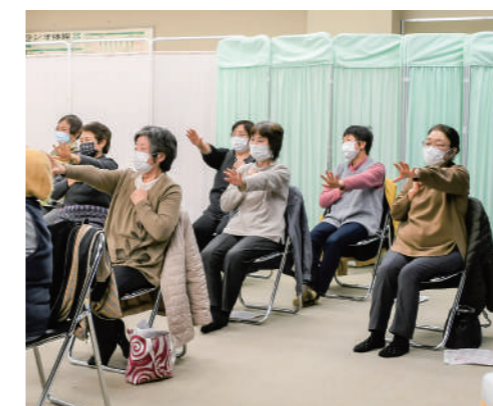
運動実技で体を動かす参加者