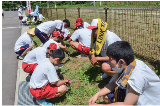
草取り作業を行う中学生と高校生