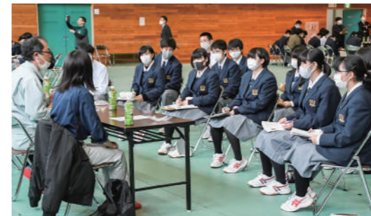
町内企業ガイダンス

葛巻高校では、2年生から主に就職、専門学校などを目指す「Aコース」と、大学、短大、医療系専門学校などを目指す「Bコース」に分かれます。進路達成率100%を継続している葛巻高校の充実した進路支援体制について紹介します。