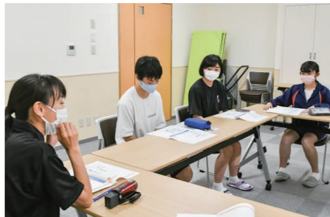
くずまきテレビのスタッフから映像制作を学ぶ高校生

8月4日に山村留学生寄宿舎で開催した企画会議では、くずまきテレビのスタッフから映像作品の基本を学びました。その後CMのテーマを話し合い、「川や星空など自然を紹介したい」「牛や牛乳など町の特徴を取り上げては」など多くのアイデアが出されました。今後生徒自ら演出や撮影を行い、10月の完成を目指します。