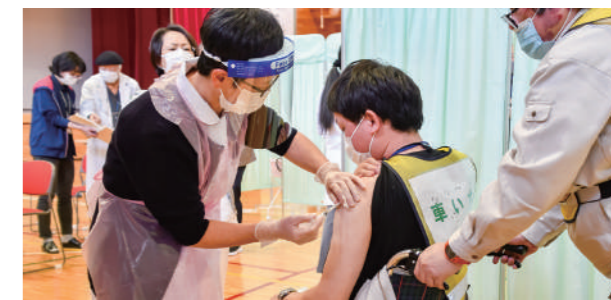
ワクチンは上腕部の肩に近い場所に接種します

受け付けから接種終了まで約40分を想定していますが、混雑すると待ち時間が長くなる場合もあります。時間に余裕をもって接種会場に行きましょう。