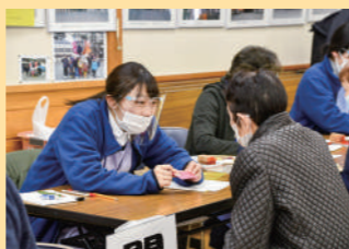
健康ポイントの説明をする職員

本年度の生活習慣病予防健診から、受診した方に「健康ポイント」として商店で利用できるニコちゃんカードのポイントを付与しています。町民の皆さんに病気の予防や健康への関心を高めてもらえるように、今後健康づくりの事業に参加した方にもポイントを付与します。