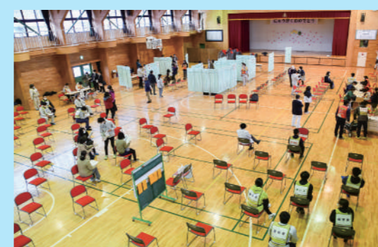
ワクチン接種の会場となる葛巻小学校体育館の様子

新型コロナウイルス 職員が集団接種訓練 4月10日、葛巻小学校の体育館で、新型コロナウイルス集団接種に従事する町職員や医療関係者約80人が、模擬対応訓練を行いました。 訓練では、職員が接種を受ける高齢者の役になり、受け付けから接種を終えて帰るまでの流れを確認。車いすの方や接種後に体調不良となった方への対応も訓練し、高齢者が安心して接種を受けられるよう準備しました。