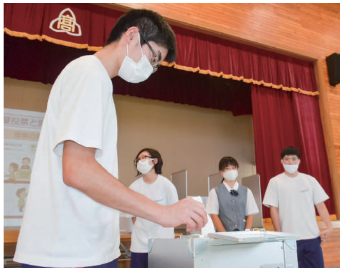
模擬選挙で投票を体験する葛巻高校の生徒たち