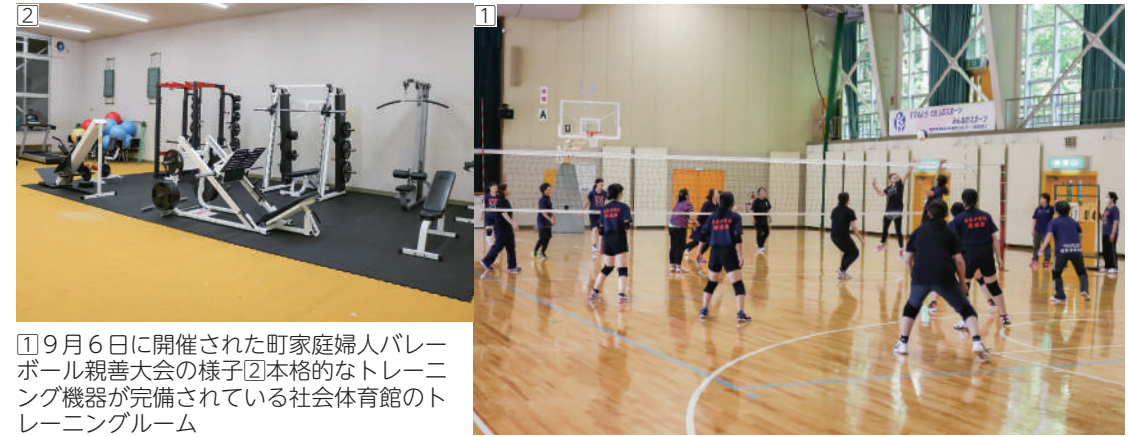
①9月6日に開催された町家庭婦人バレーボール親善大会の様子②本格的なトレーニング機器が完備されている社会体育館のトレーニングルーム

「地域みらい留学365」や「組織化づくり」など、新たに取り組むものもあるため、高校の先生方の力を借りながら形にしていきたいです。自分が懸け橋となり、子どもたちが地域の大人と接することでさらに自信を付け、自分の目標を達成し、いずれ葛巻町に戻って来られるようなきっかけづくりをしていきたいと思っています。