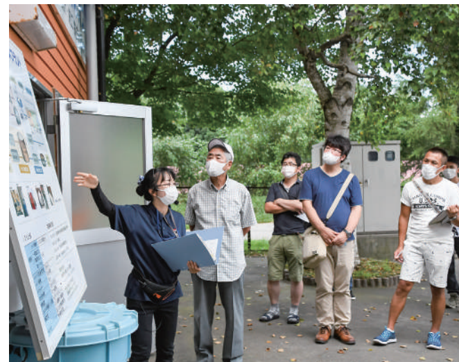
バイオガスプラントの仕組みを学ぶ参加者たち