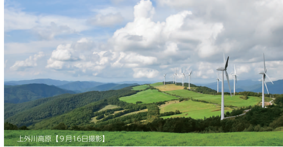
上外川高原【9月16日撮影】

令和元年度の決算が町議会9月定例会議で認定されました。決算の概要からみた町の財政状況についてお知らせします。