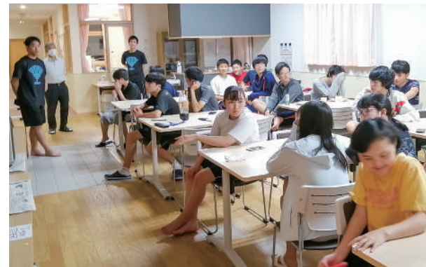
全員が出席し食堂で行われる夕点呼の様子