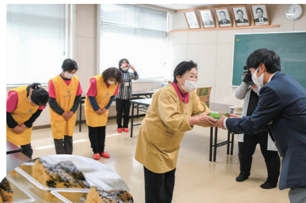
葛巻高校に出来たての「牛乳入りがんづき」を届ける町食生活改善推進員協議会の皆さん

ふっくらと蒸し上がったがんづきは、各クラスの保健委員が代表して受け取り「みんなでおいしくいただきたいと思います」と感謝を述べ、その後、生徒一人ひとりに手渡されました。感染症防止のため、例年開催している郷土料理講習会は中止に。今年はこれまでとは違う形で、生徒らにふるさとの味を伝えようと取り組まれました。