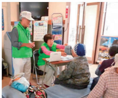
まちの駅くずまきでの血圧測定の様子