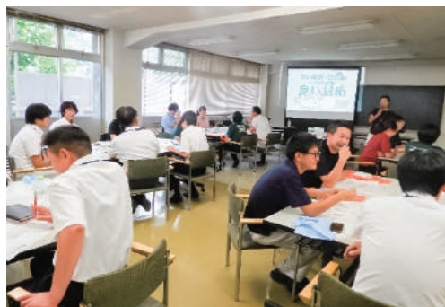
ゲートキーパー養成講座の様子

めぐだまる会：保健センターの入浴日に合わせて、傾聴活動を実施。 おしゃべりサロン：まちの駅くずまきで、バス利