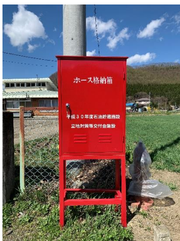
平成30年度に整備したホース格納箱