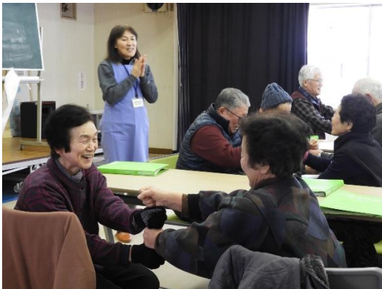
歯つらつ栄養教室