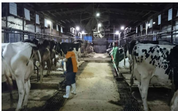
酪農を支えるヘルパー