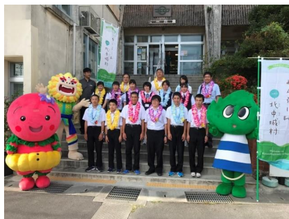
姉妹町村沖縄県北中城村中学生訪問交流