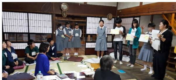
「若者が集える場所」を考えるワークショップ