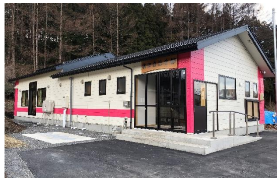
平成30年度に整備された泉田自治会館