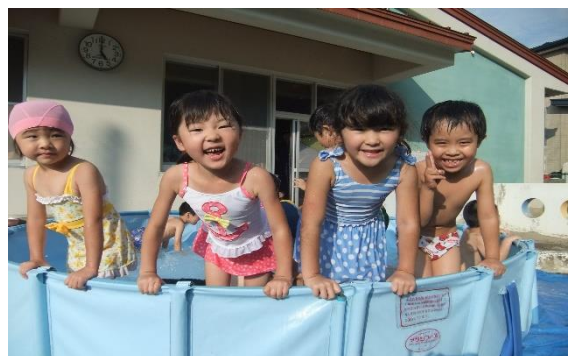
夏に水遊びをする園児たち

(10月から保育料がかかるのは、住民税課税世帯の第1子で、0歳児から2歳児のみとなります。)