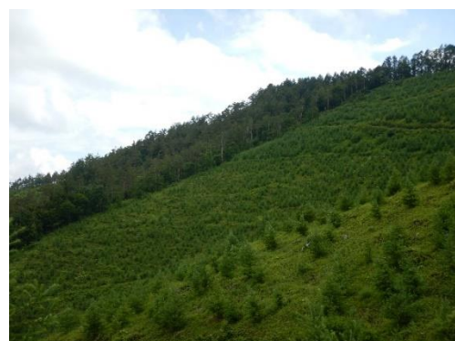
整備された公有林