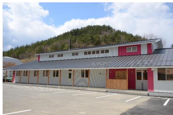
山村留学生寄宿舍