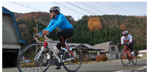
観光PR検討部会での取り組み