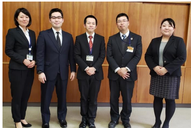
地域おこし協力隊