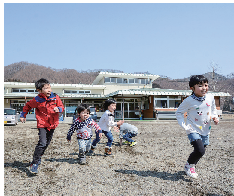
元気に遊ぶ江刈保育園児

一般会計予算の詳しい内訳は4〜5ページを、主な新規事業は6〜7ページをご覧ください。 (※) 投資的経費 施設建設など社会資本の整備にかかるお金