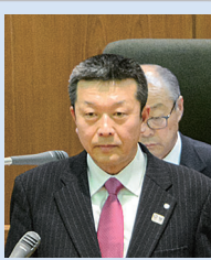
町長 施政方針 (要約)

31年度は、町総合計画・前期基本計画の最終年度、中期基本計画の策定年度であることから、これまでの取り組みを振り返り、磨きをかけ、さらに一歩前進します。引き続き、希望に満ちあふれた「まちづくり」を進め、町民が安全で安心して暮らせる環境の構築に全力を傾けます。 自動車専用道路「北岩手・北三陸横断道路」の整備は、盛岡以北の地域間の交流・連携や地域経済の活性化、多面的分野の発展、人口減少問題の解決に影響を及ぼすことから力強く進めます。今後住民のニーズを的確に捉え、町が持つ機能と魅力である「葛巻らしさ」が光る取り組みに英知を結集し、積極果敢に挑戦します。