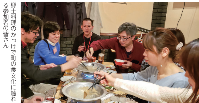
郷土料理のかっつけで町の食文化に触れる参加者の皆さん