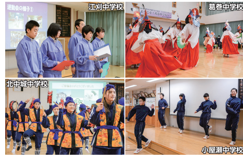
各学校の紹介や郷土芸能などを発表し交流を深めた歓迎会の様子

本町と北中城村の中学生による交流は、平成10年から始まり、隔年ごとに互いの町村を訪問しています。夏には町内の中学生が北中城村を訪問する予定になっており、交流を重ねることで互いの環境や文化の違いを学び、さらなる絆の強まりが期待されます。