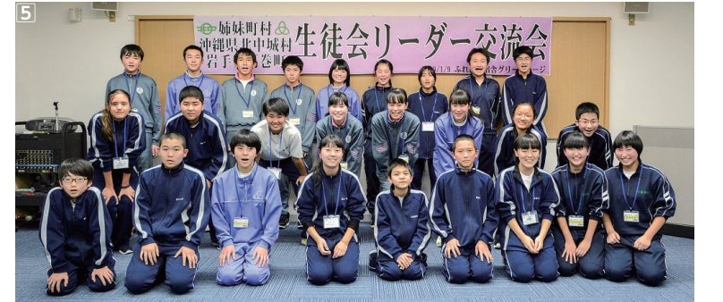
①②郷土料理作りに挑戦する生徒たち③④交流を深めたレクリエーションの様子⑤生徒会リーダー交流会に参加した生徒たち