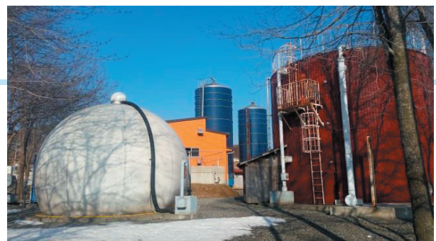
土谷川のバイオマスプラント

「新しくまき型酪農構想」の実現に向けて、牛の増頭を進めるに当たり、堆肥を還元する圃場の不足による家畜ふん尿処理の問題が見込まれます。その解決策として畜ふんバイオマスプラントの整備を図り、家畜ふん尿の適正処理の推進を図るため、施設建設用地の選定等に係る調査業務を行います。