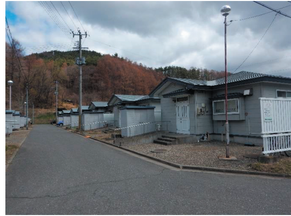
経年劣化が進む町営住宅