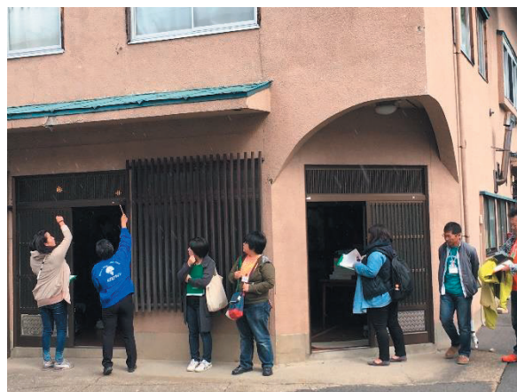
空き店舗の活用を考えるワークショップの様子