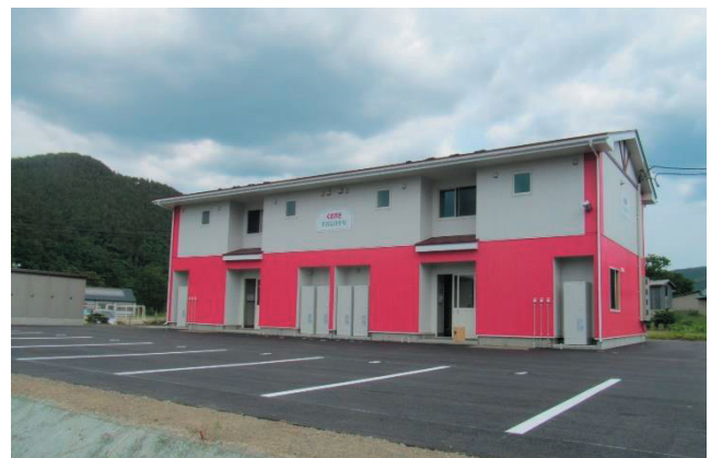
五日市定住促進住宅