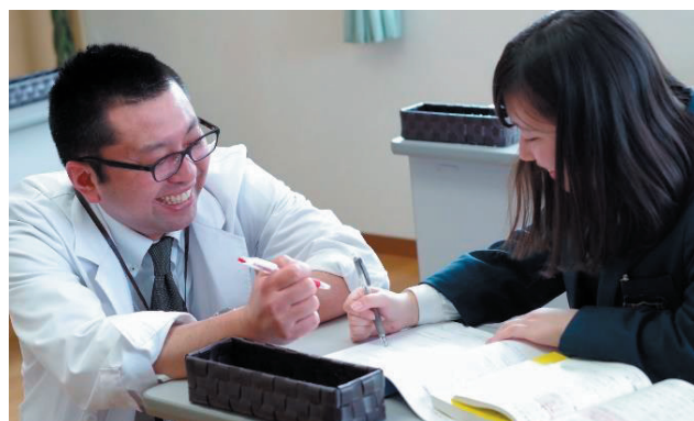
葛巻町学習塾の授業風景