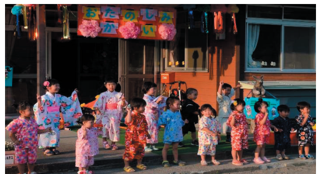
夏のお楽しみ会（江刈保育園）