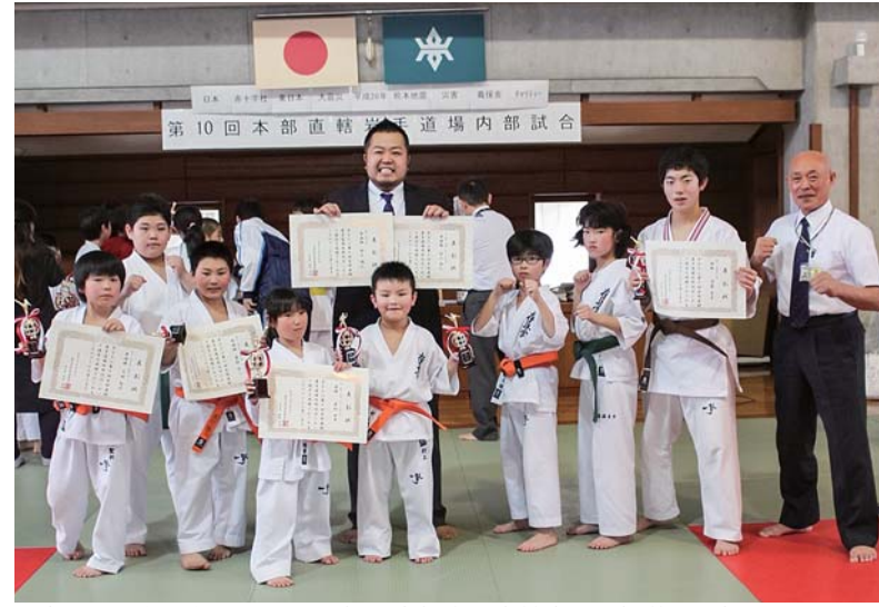
数多くの上位入賞を果たした極真会館本部直轄岩手道場葛巻道場の皆さん

国際空手道連盟極真会館本部直轄岩手道場の第10回内部試合は3月4日、県営武道館で県内の各道場から約60人が参加し開催されました。葛巻道場からは5歳から中学校3年生までの9人が出場。入門して1~2年と日が浅い小学校低学年以下の子どもたちが上位入賞を果たす活躍ぶりを見せました。