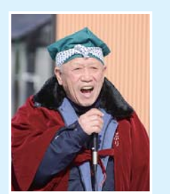
門打ち 【3/4・茶屋場えんぶり 保存会