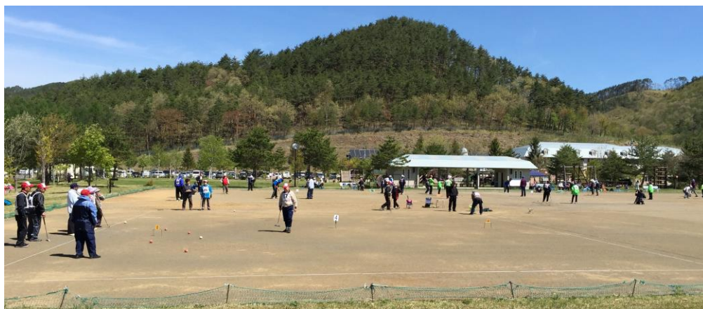
人工芝生化予定の総合運動公園ゲートボール場