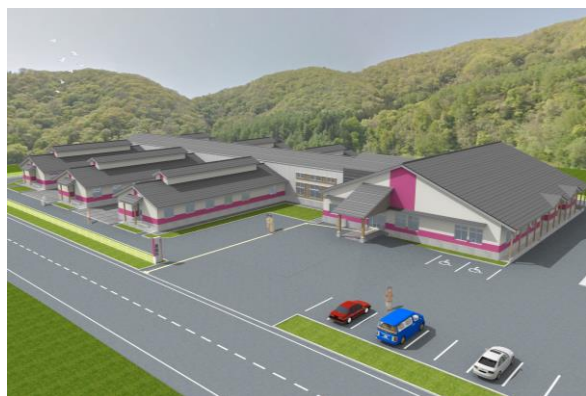
新しい葛葉荘の完成イメージ