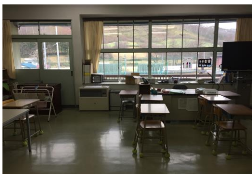
小屋瀬小学校の普通教室