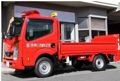
導入予定の資機材搬送車のイメージ