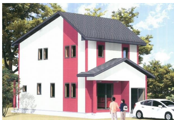
子育て支援住宅の完成イメージ