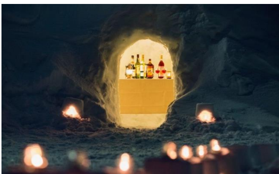
同事業で実施したグランピング事業のひとコマ