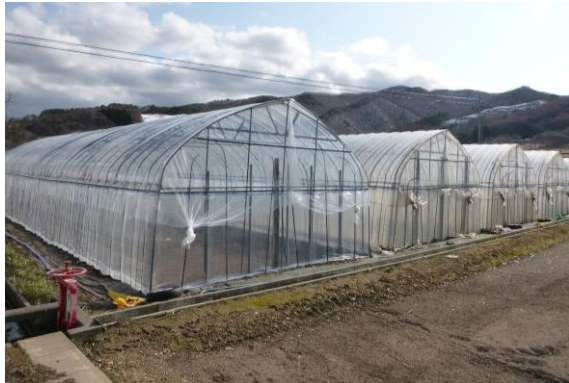
廃熱を利用した温室栽培を目指します