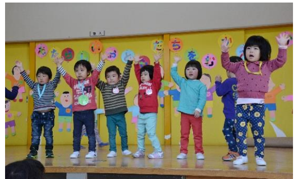
新入園児を迎える会（葛巻保育園）