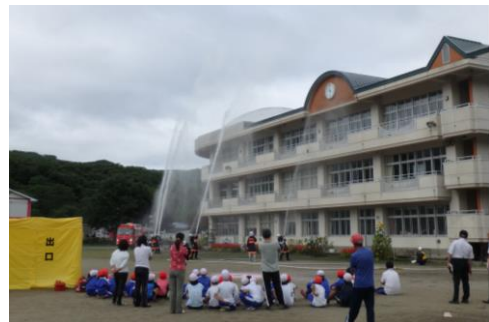
消防団の訓練風景