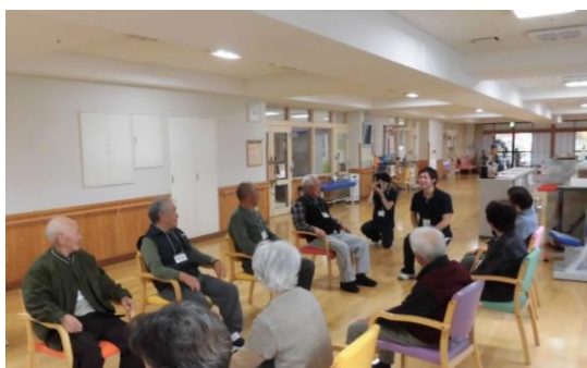
楽しみながら運動機能の維持を図ります

要介護状態等になることの予防や軽減、悪化の防止につなげ、地域で自立した日常生活が送られるよう支援します。