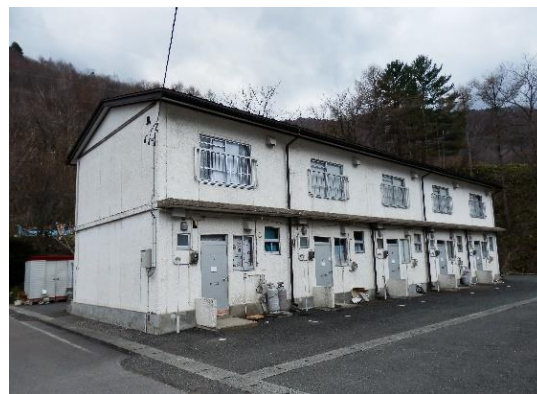
経年劣化が進む町営住宅