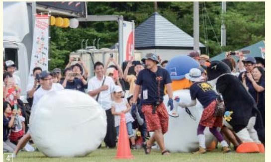
①ソフトクリームを買い求めての長蛇の列②会場一体となって盛り上がるトークショー③ご当地企画の焼き肉早食い競争④白熱した戦いを見せた乾草ロール転がし対決