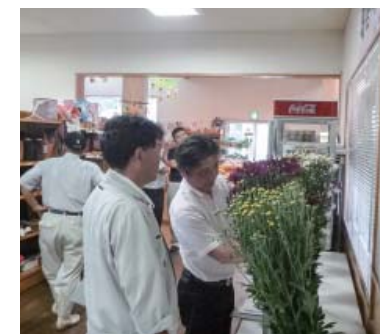
色や形、バランスなどを入念に審査