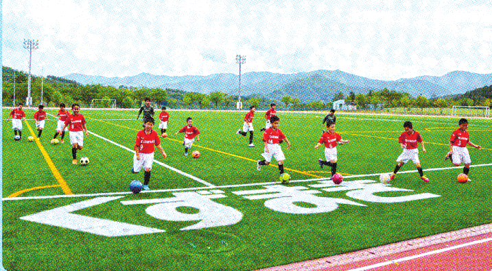
グリーンの上で元気いっぱい走り回る子どもたち。人工芝サッカーコート、陸上トラックのほか、野球場、テニスコートも完備