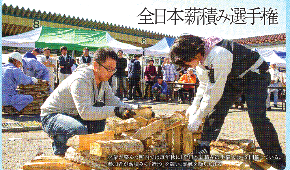
林業が盛んな町内では毎年秋に「全日本薪積み選手権大会」を開催している。参加者が薪積みの「造形」を競い、熱戦を繰り広げる