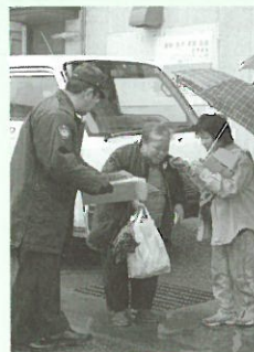
関係者から黄色い羽根を つけてもらう歩行者⑥

三日市が開かれた4月13日、町交通安全協会や交通安全母の会などが参加し、交通安全を呼び掛ける街頭PRを行いました。