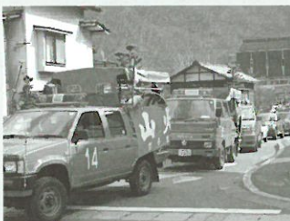
出発の後、3班に分かれて 町内をパレードする関係者

山火事防止パレードは4月15日行われ、消防車両や林業団体の広報車など16台が町内をパレードし、山火事防止を呼び掛けました。