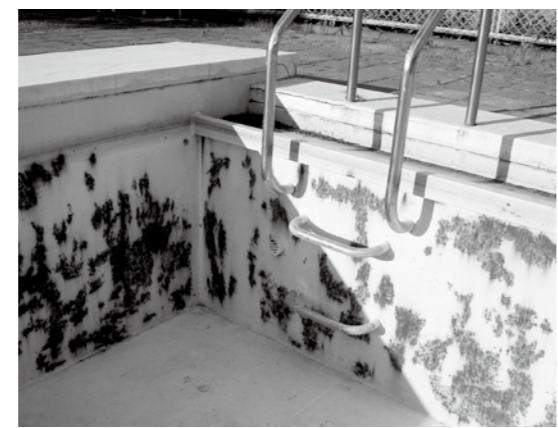
ペンキ塗り前の状況

③学校周辺は風が強く対応に困っています。試験的に校庭の一部を樹皮で舗装し現在観察を続けています。同じような整備をした他町村の校庭も比較的良好なことから検討を進めてまいります。幸い、校庭での事故等は、報告されていません。