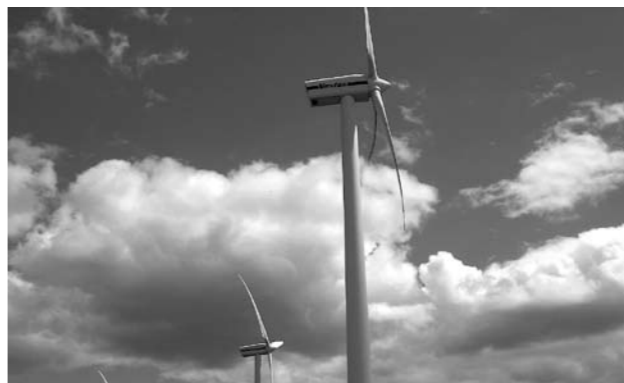
上外川風力発電所

町では、環境問題などから、現在ペレットストーブや薪ストーブの購入者に対して補助しています。が、クリーンエネルギーの町を実感できる、さらなる施策を考えているのか。 町長 現在、本町には、2箇所の風力発電施設があります。風力発電施設に係る固定資産税は、風車や送電鉄塔などの償却資