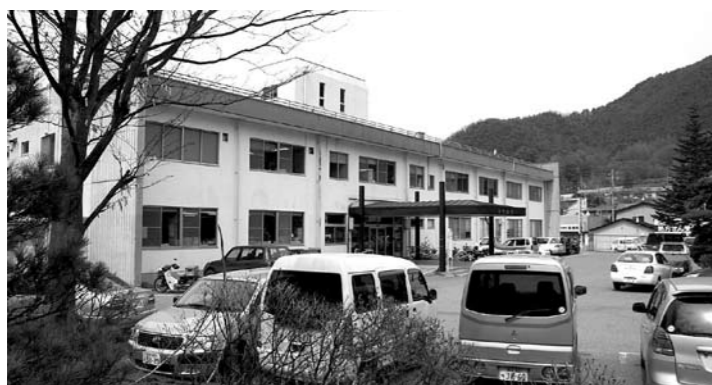
経営改善に取り組む葛巻病院

議員 住民生活において病院は欠かせないものであり、住民が望む本来あるべき信頼される葛巻病院への取り組みは何か。