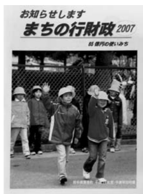
今年も発行します。

連結決算ということを見ずえた場合、町づくりの基盤となる財政状況と、行政活動全般を一体的に整理し、町民にわかりやすく端的に公表していく行為は重要なことだと認識しております。