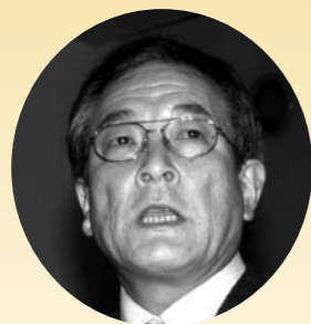
はし せい こう 橋場 清廣議員

ストーブなど身近なエネルギー利用を重点的に支援するため、50万円の特別枠を予算計上しました。 ほかに先駆けてのクリーンエネルギー推進は誇れる行動であり、そのことにより町民こそ恩恵を受けられるよう、各種施策を展開してまいります。