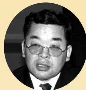
あね たい はる じ 姉帯 春治議員