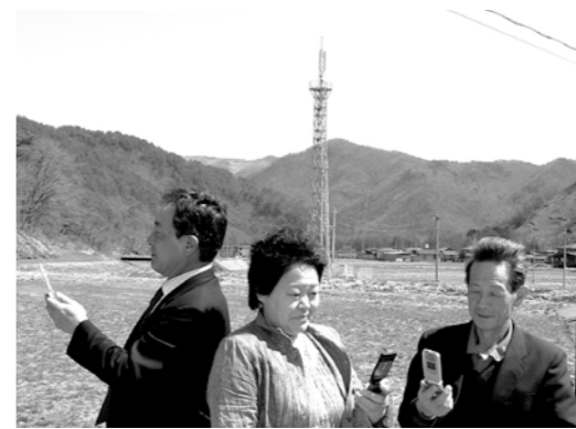
広報委員が確認 (小屋瀬地区)

答 小屋瀬、元木地区は、3月7日供用になった。冬部は4月からの見込み。今後は星野、畑地区が民間により拡大する可能性がありますが引き続き強く要請します。