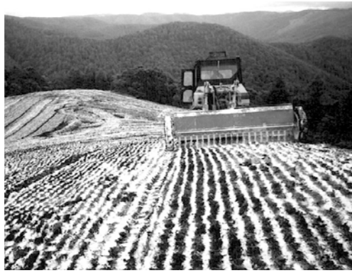
草地整備事業 (炭カル散布)