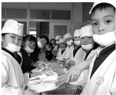
4月9日久しぶりの給食

答 事件になった工場で作られたロールキャベツが給食に使われる予定だったが未然に回避できた。今後は出来れば町内、県内、国内の食材を使い安全安心、質の良いものを提供したい。