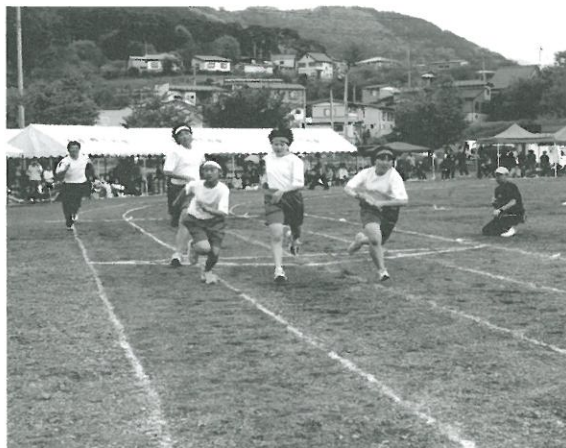
整備工事が予定される葛巻中学校グラウンド