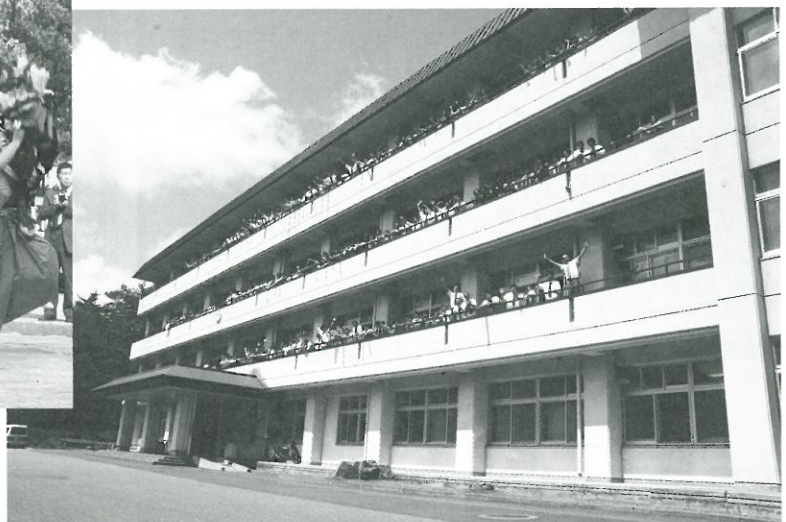
町民が存続を願う町内唯一の県立葛巻高校