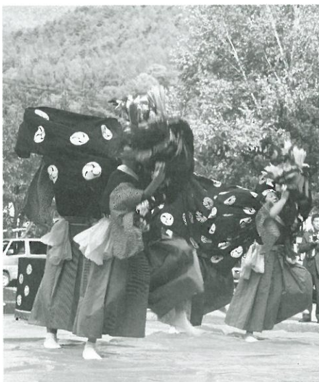
全国大会に出場する郷土芸能部