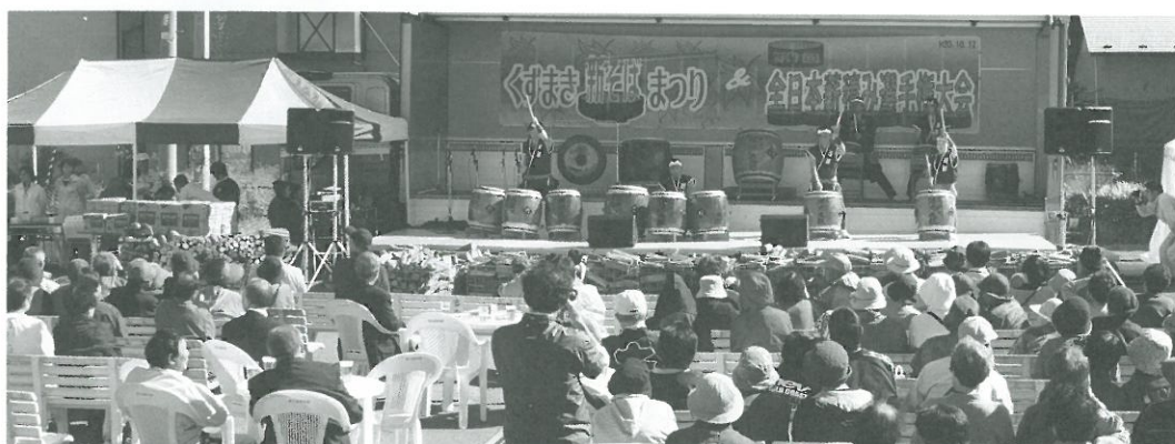
多くの来場者でにぎわう、年間を通して行われるまちなかイベント