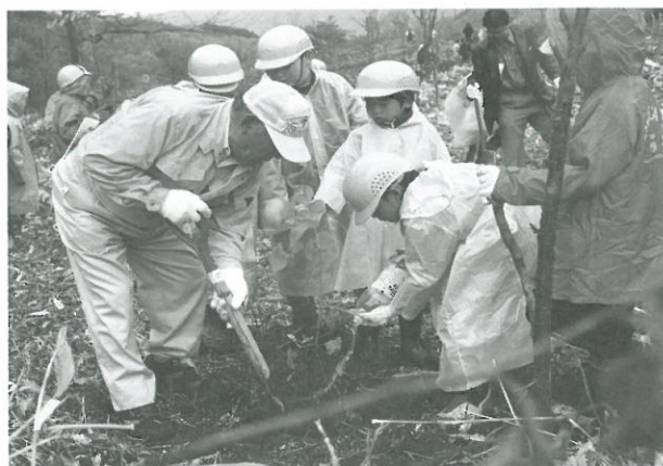
豊かな自然を守り次世代へ、町植樹祭