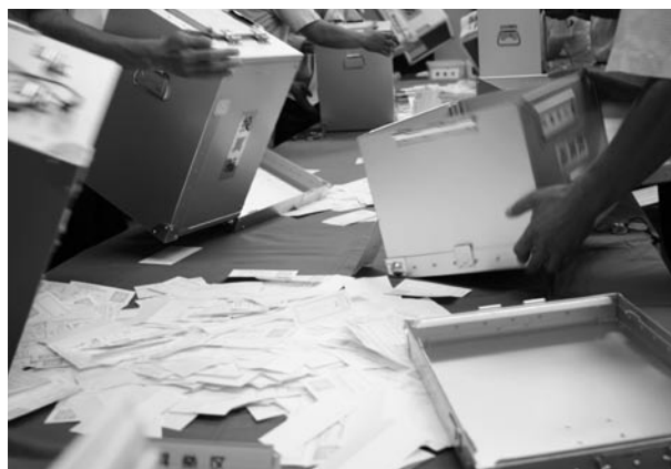
参議院議員選挙は今年の夏に予定されています