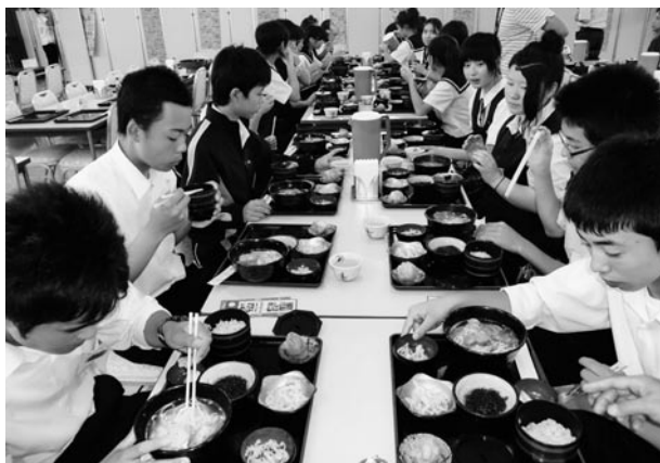
町内中学校と沖縄県北中城中学校との交流 (北中城村にて)