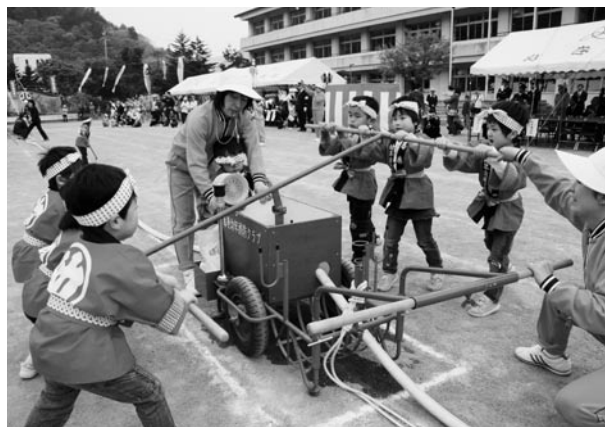
安心・安全がほくたちの願いです (幼年消防クラブ／消防演習)