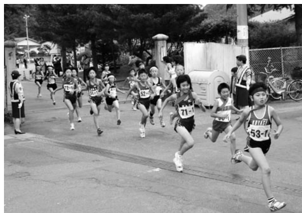
タスキをつないで町を駆け抜ける子どもたち (町民駅伝継走大会)