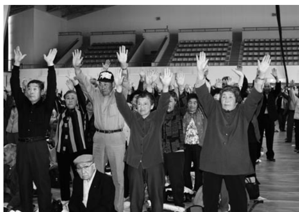
健康で長生きが一番です (長寿を祝う会)