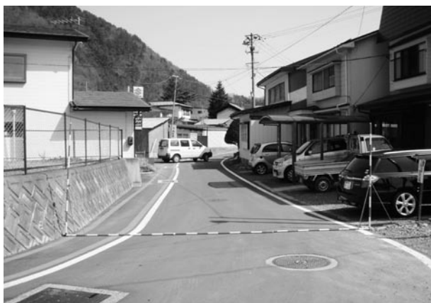
平成21年度に改良工事が行われた町道町裏線

歩道の整備を行い、車道と歩道とを分離することにより、通行する学童や一般歩行者の快適性と安全確保を図ります。