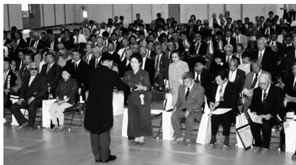
葛巻町合併 50 周年記念式典 功労者表彰