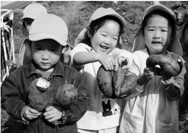
子どもたちの笑顔が元気をくれます （葛巻保育園／農園の収穫）