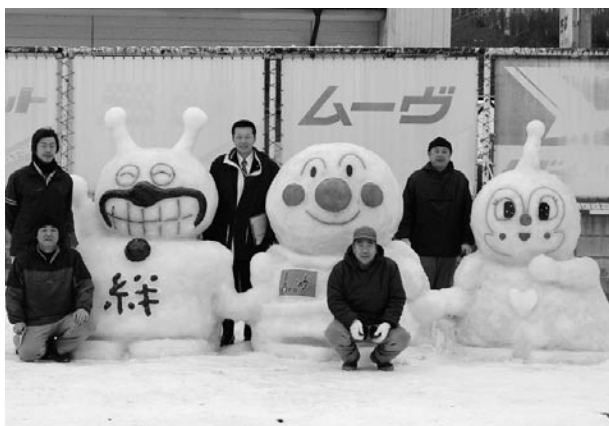
まちなか雪だるまコンテストで町長賞を受賞した(有)葛巻自動車整備工場の作品