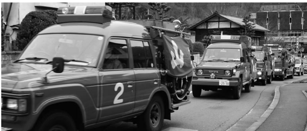
わたしたちの地域を守る消防団（山火事防止パレード）