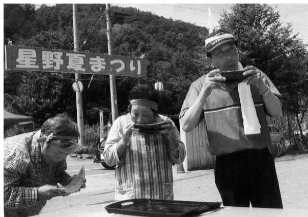
結いの再生事業「星野夏まつり」 (星野自治会)