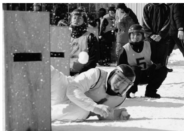
第3回目を迎えるまちなか雪合戦大会 (昨年度の大会の様子)