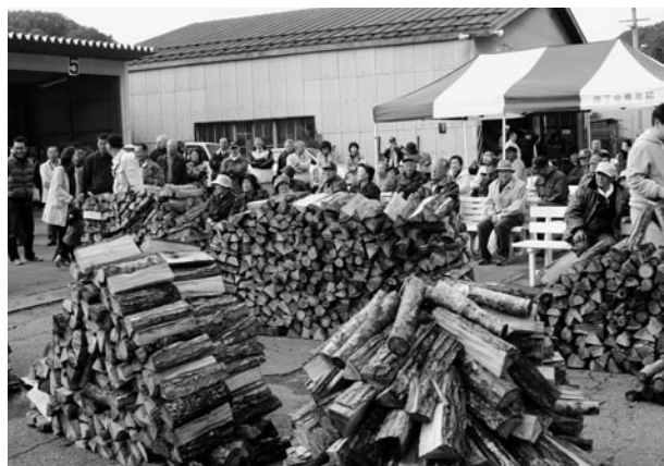
恒例となったまちなかイベントは大盛況です (薪積み選手権大会)