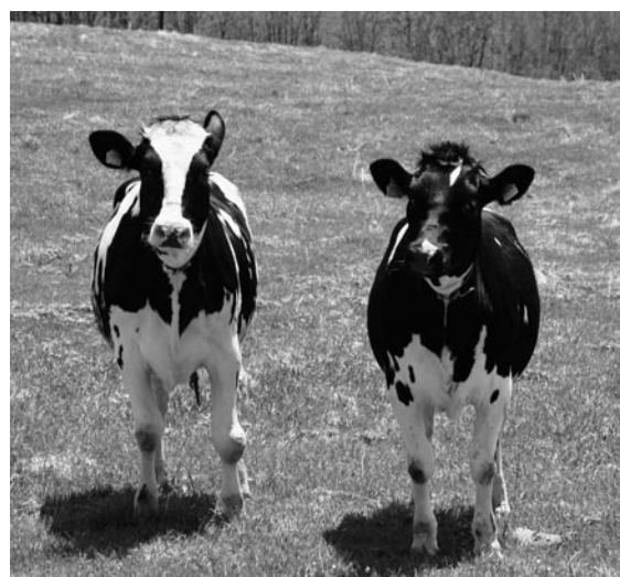
「はい、チーズ！」(袖山高原放牧)