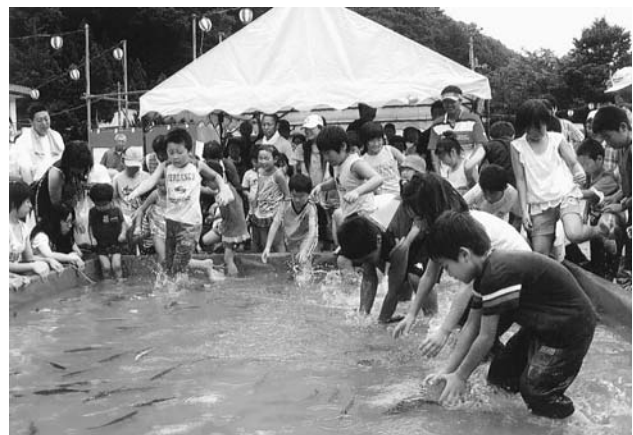
星野地区夏祭りの様子