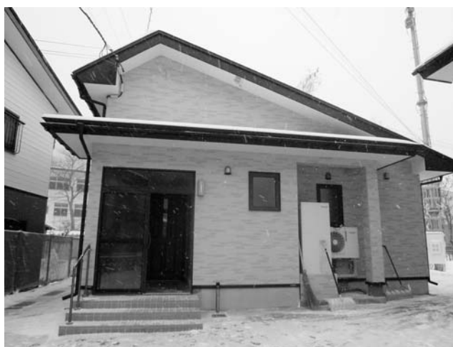
昨年度整備された医師住宅

・生ごみ回収作業車両 1台 ・生ごみ回収ボックス ・ごみ出しカレンダー、ごみの出し方辞典