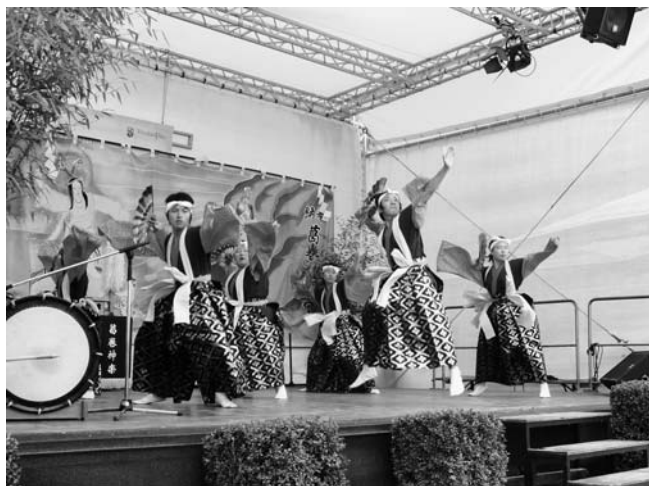
葛巻高校のドイツ交流派遣事業