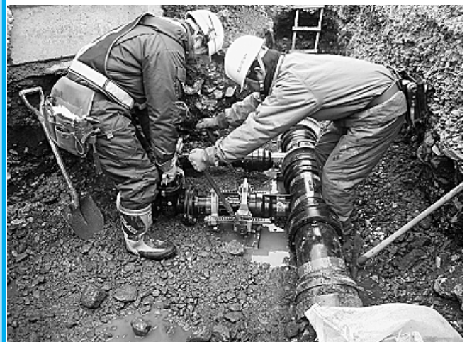
水道管更新作業の様子

江川簡易水道施設の改良と統合を含めた調査を行い、基本計画と基本設計を策定します。