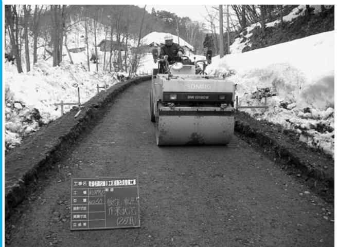
道路改良工事の様子