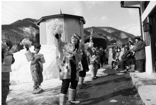
茶屋場えんぶり保存会の門打