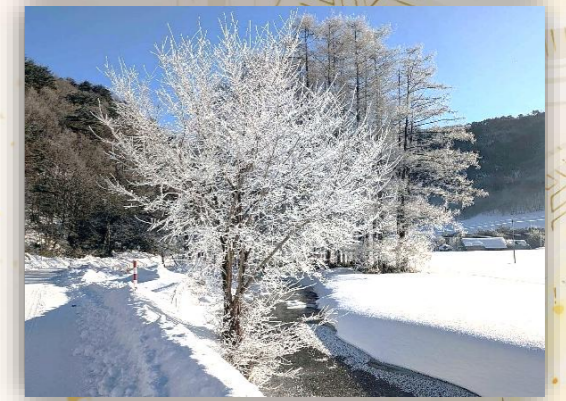
「霧水の朝」