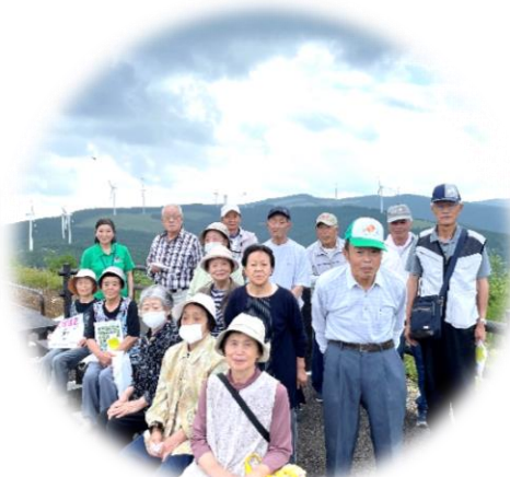
視察研修(小田学級)