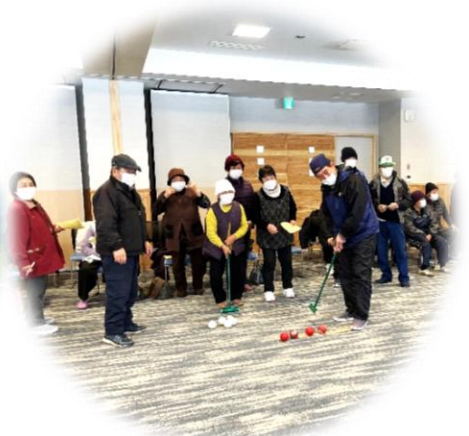
新春スポーツ交流会 (江刈地区合同)