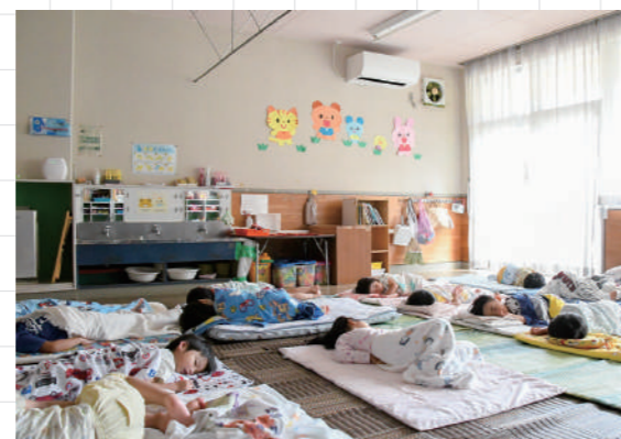
保育園エアコン設置事業では各保育園の部屋や事務室にエアコンを設置