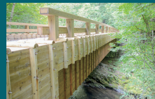
森林環境譲与税を充当して修繕した町道上外川線の「たかばし」

で、最も増加したのは農林水産業費で、前年度比9,856万円(22.8%)の増となり、主要要因は、畜産生産資材価格等高騰対策支援事業や畜産労働力負担軽減対策事業などによるものです。5つの特別会計の歳出決算総額は、31億1,710万円、前年度比4億2,483万円(15.8%)の増となりました。一般会計と特別会計を合わせた歳出決算総額は101億6,376万円となり、前年度比7億7,983万円(7.1%)の減となりました。