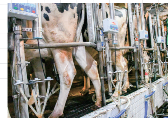
畜産労働力負担軽減対策事業を活用して導入されたミルクキングパーラー