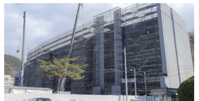
整備が進む役場新庁舎